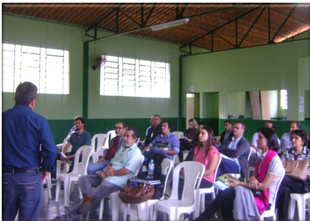
Figura 1. 3ª Reunião Ordinária do Preto Paraibuna, em 30.06.2016, em Belmiro Braga/MG