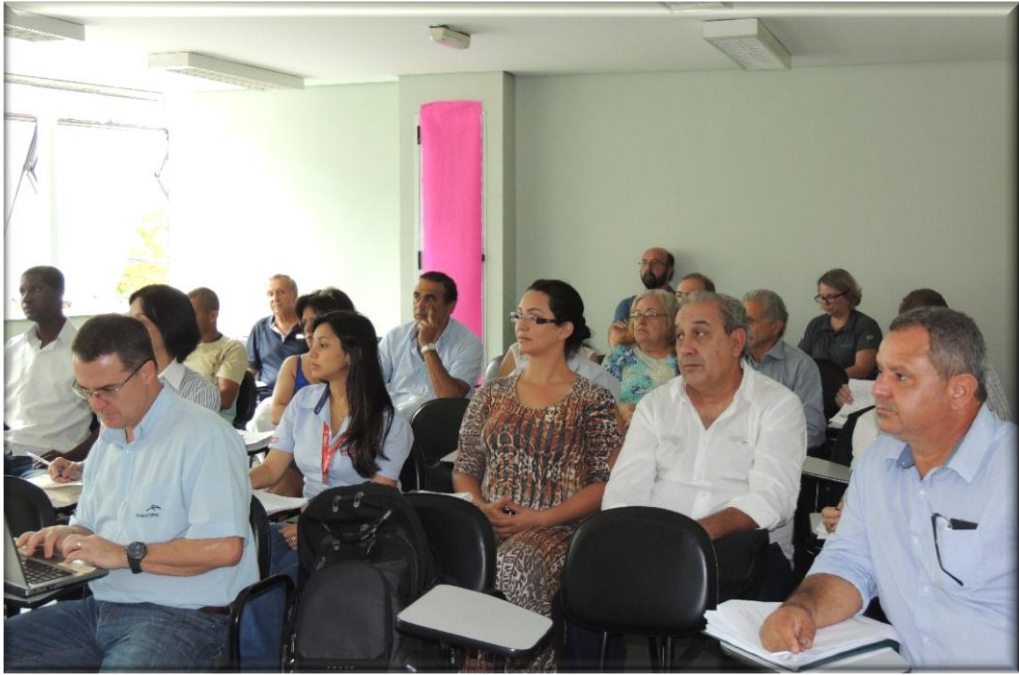
Figura 4. Plenária 5ª Reunião Ordinária do Preto Paraibuna, em 27.10.2016, em Juiz de Fora/MG