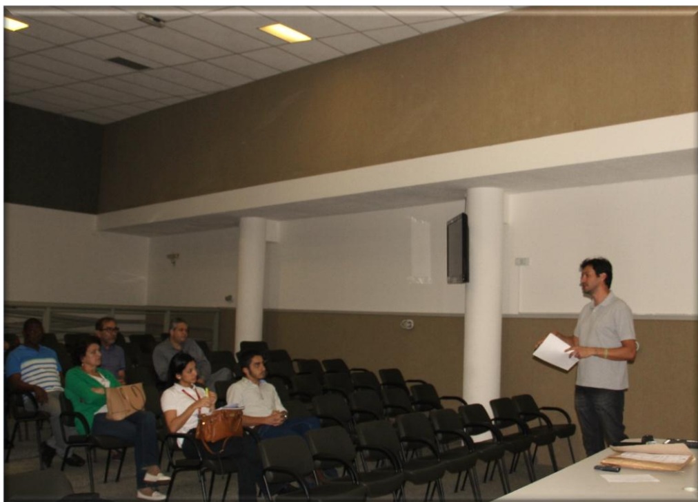
Figura 2. 4ª Reunião Ordinária do Preto Paraibuna, em 09.08.2016, em Juiz de Fora/MG