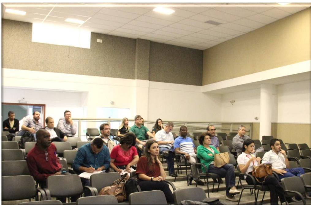
Figura 3. Plenária 4ª Reunião Ordinária do Preto Paraibuna, em 09.08.2016, em Juiz de Fora/MG